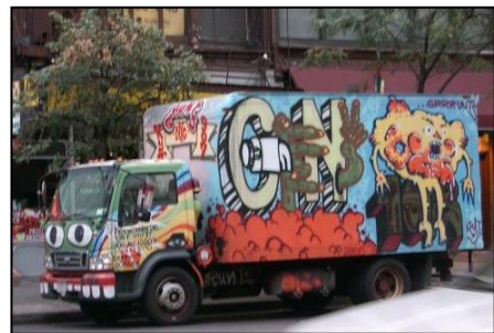
משאית רגילה הנושאת מכולה