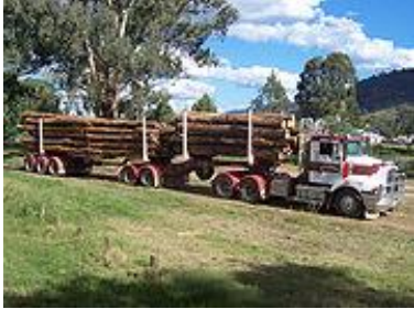
משאית גוררת + נגרר